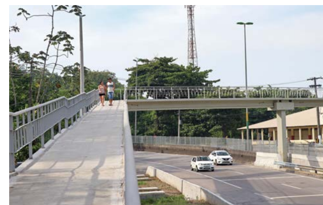
A nova passarela instalada próximo ao Curvão de Suruí é a 25ª entregue pela CRT na Rodovia Santos Dumont