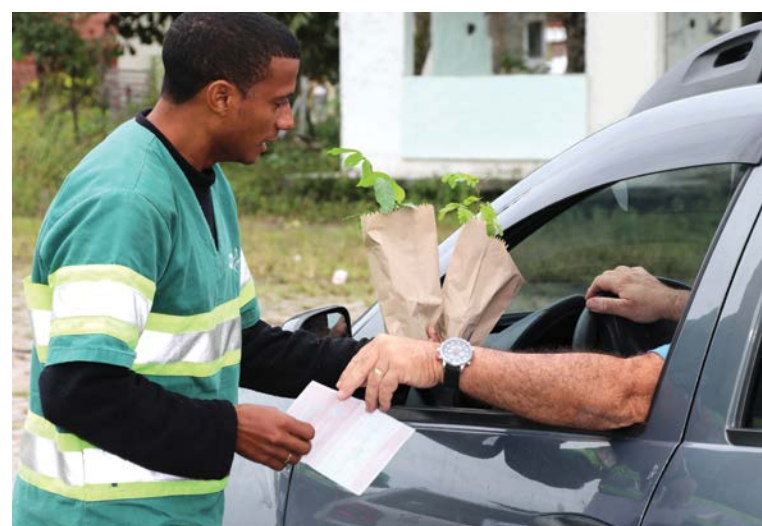
Funcionários da CRT orientaram os usuários sobre como e onde plantar as espécies doadas

A CRT tradicionalmente realiza essa ação no Dia Internacional do Meio Ambiente como forma de lembrar seus usuários de que a BR-116/RJ está inserida numa região com grandes áreas preservadas da Mata Atlântica, como os parques Nacional da Serra dos Órgãos e o Estadual