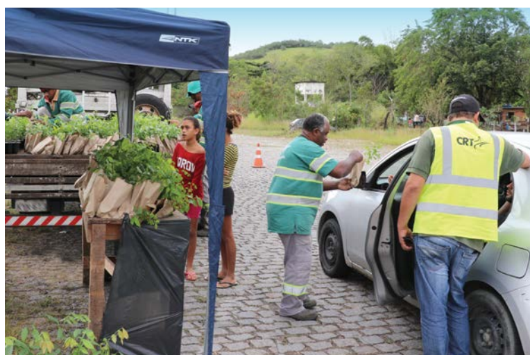
Um posto de distribuição foi montado logo depois do pedágio de Bongaba no sentido Teresópolis para a entrega das mudas

dos Três Picos. E que, por isso, qualquer intervenção no meio ambiente em sua área deve ser cercada de cuidados, procurando-se manter as características ambientais originais. ■